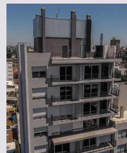
CONDO NELLO II Alem 2450. Rosario.